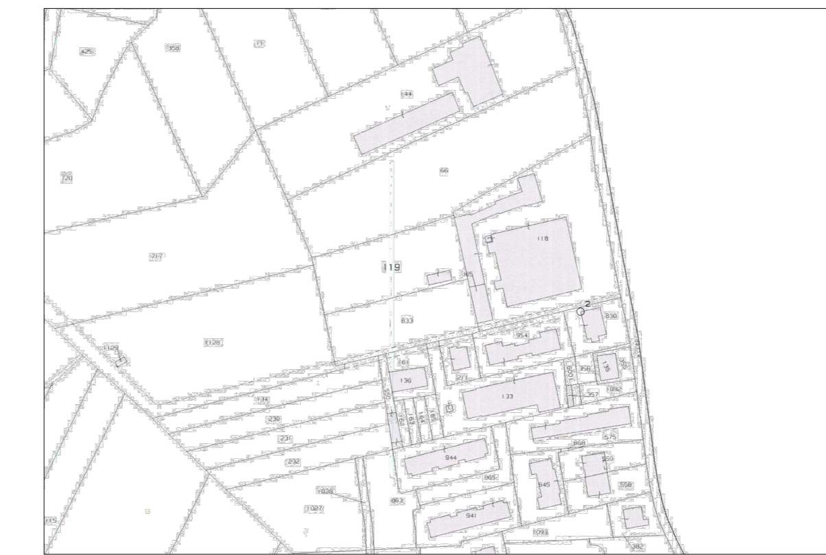
ESTRATTO DI MAPPA CATASTALE Foglio N°5 PART. 833, 119