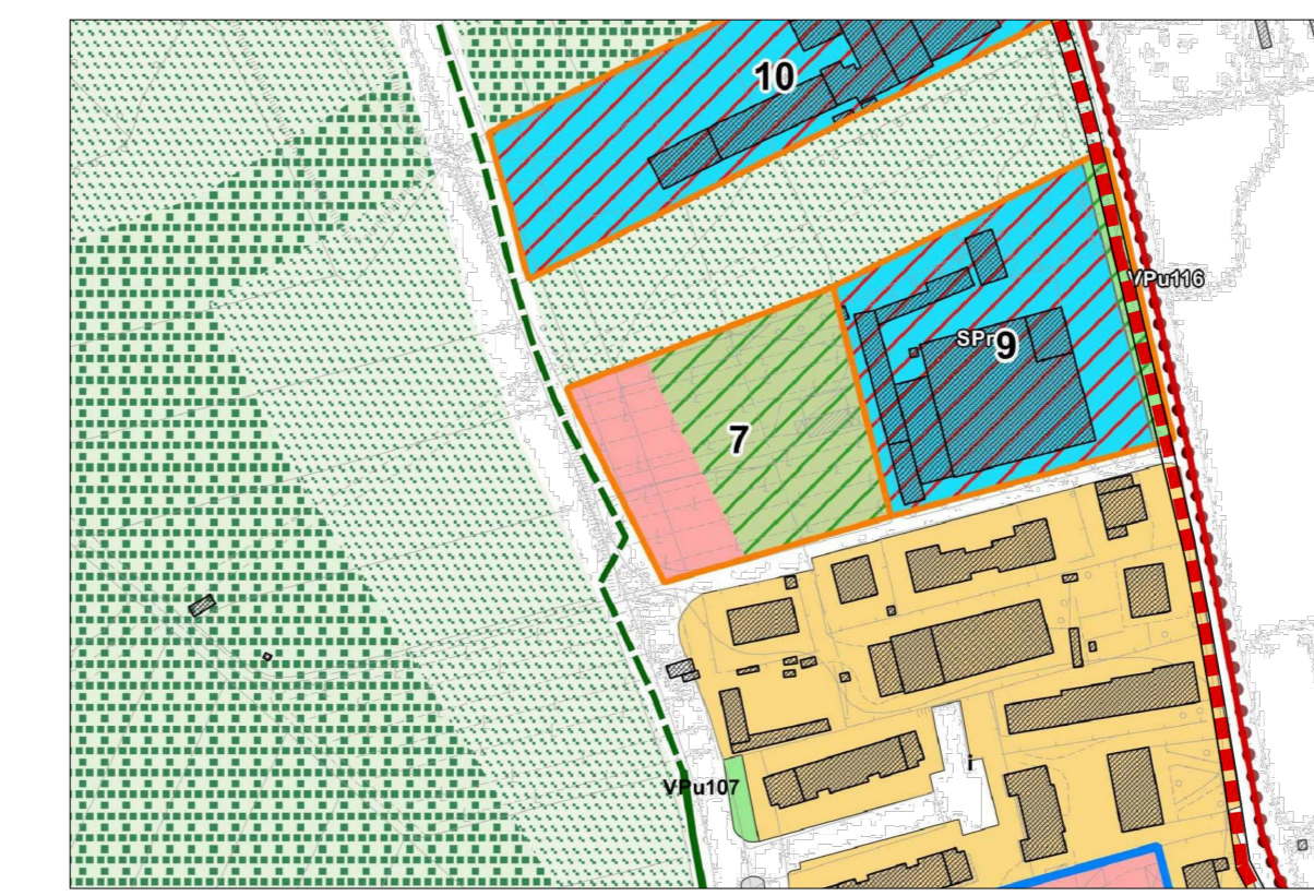
ESTRATTO DI R.U. AREA N°7